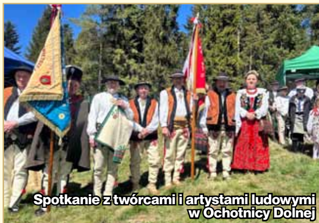
Spotkanie z twórcami i artystami ludowymi w Ochotnicy Dolnej