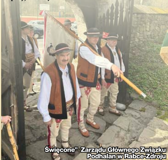
„Święcone” Zarządu Głównego Związku Podhalan w Rabce-Zdroju

W niedzielę, 2 kwietnia, w rocznicę śmierci Ojca Świętego Jana Pawła II Oddział zorganizował modlitwne czuwanie w kościele parafialnym w Kamienicy. Celem wydarzenia było przypomnienie wybitnego papieża – Polaka oraz wyrażenie solidarności w obronie jego dobrego imienia. W atmosferze zadumy i wdzięczności uczestnicy dziękowali za wielki pontyfikat św. Jana Pawła II. W wydarzeniu wzięli udział mieszkańcy Gminy Kamienica oraz członkowie zaprzyjaźnionych Oddziałów.