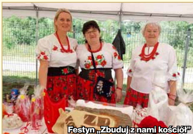
Festyn „Zbuduj z nami kościół”