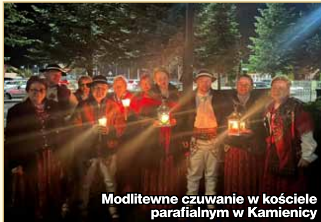
Modlitwne czuwanie w kościele parafialnym w Kamienicy