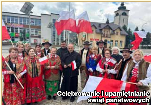
Celebrowanie i upamiętnianie świąt państwowych