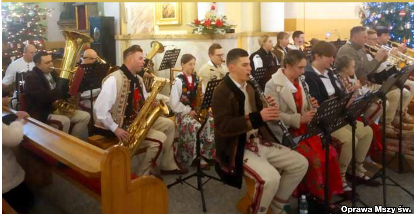
Oprawa Mszy św.