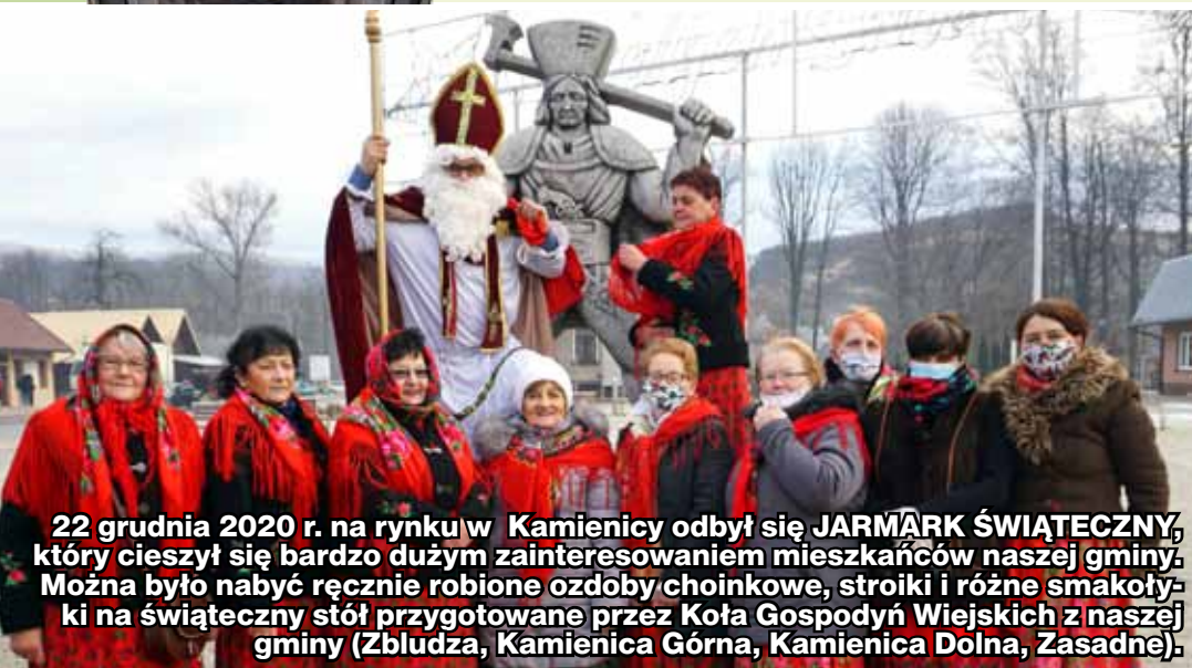
22 grudnia 2020 r. na rynku w Kamienicy odbył się JARMARK ŚWIĄTECZNY, który cieszył się bardzo dużym zainteresowaniem mieszkańców naszej gminy. Można było nabyć ręcznie robione ozdoby choinkowe, stroiki i różne smakołyki na świąteczny stół przygotowane przez Koła Gospodyń Wiejskich z naszej gminy (Zbludza, Kamienica Górna, Kamienica Dolna, Zasadne).