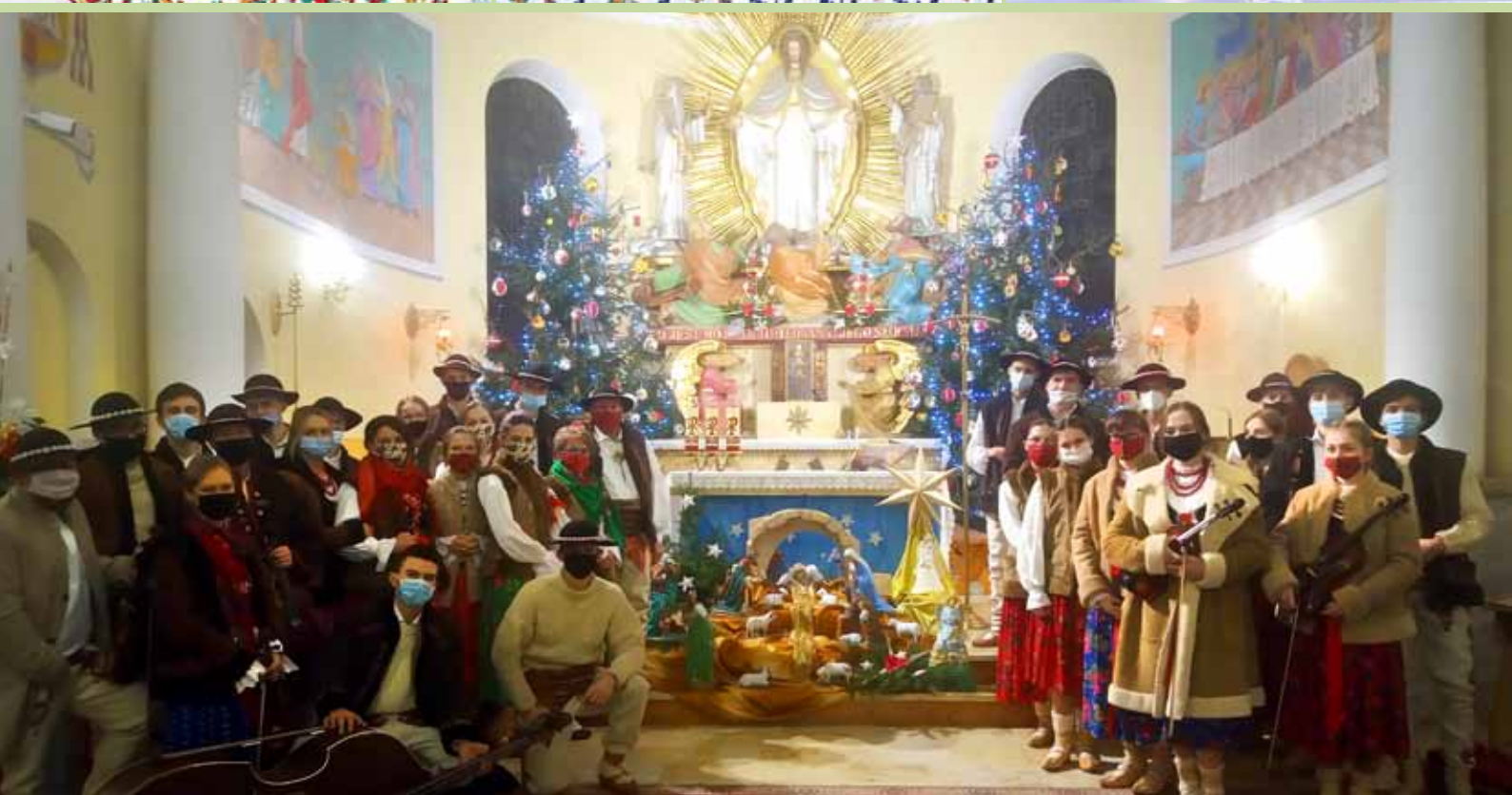
Kolędowanie to tradycja, której górale są bardzo wierni i nikt nie potrafi tak jak oni zarazić widownię energią i śpiewem. 24 grudnia 2020 r. Zespół Regionalny GORCE, działający przy Gminnym Ośrodku Kultury wystąpił w kamienickim kościele z koncertem kolęd i pastorałek.