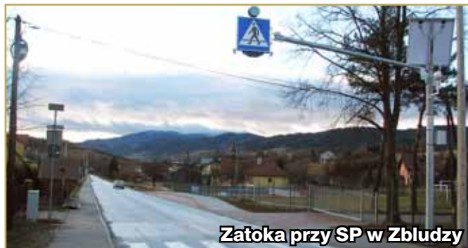
Zatoka przy SP w Zbludzy

W grudniu zeszłego roku oddano do użytku dwie nowe zatoki autobusowe w ciągu drogi powiatowej Limanowa – Kamienica w miejscowości Roztoka.