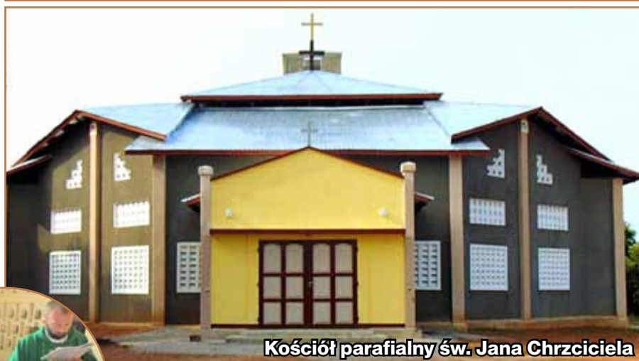
Kościół parafialny św. Jana Chrzciciela

ludzi, zwłaszcza kamieniczian i tarnowian. Pomimo pandemii i panujących restrykcji tyle dobra i życzliwości w tym czasie mnie spotkało. Dziękuję z serca Bogu za to wszystko. Z takim przeświadczeniem bardzo dobrze będzie mi wracać do Beninu. Nie mogę tutaj pominąć moich drogich rodziców i rodzeństwa, z którymi każda chwila jest bezcennym skarbem nie do kupienia i nie do zdobycia. Cieszę się, że Pan Bóg tak wspaniałą rodzinę postawił na mojej drodze życiowej.