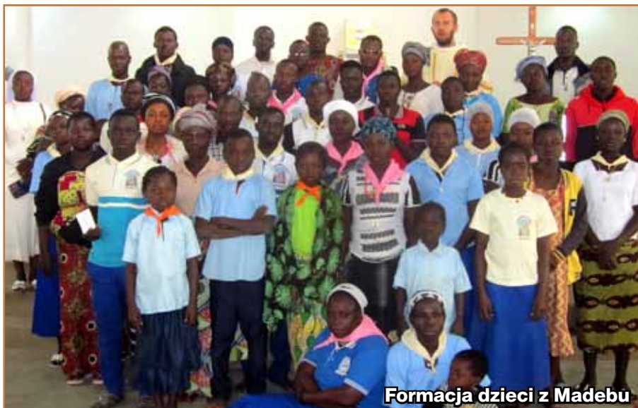
Formacja dzieci z Madebu

► mnie również warunki i funkcjonowanie tamtejszych ludzi. Niektórzy nic naprawdę nie mają - żadnego dorobku materialnego, ale potrafią się wszystkim dzielić z innymi i są bardzo życzliwi. Najbardziej to widzę podczas posiłku i przygotowanej gościnie, gdy przybywam do wspólnoty chrześcijan, aby szafować sakramenty i odprawiać Msze Świętą.