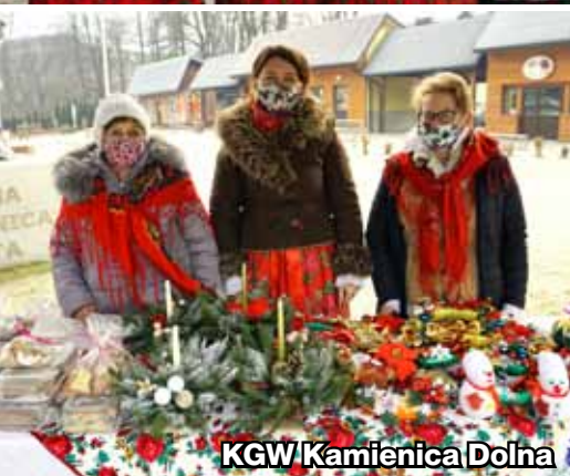
KGW Kamienica Dolna