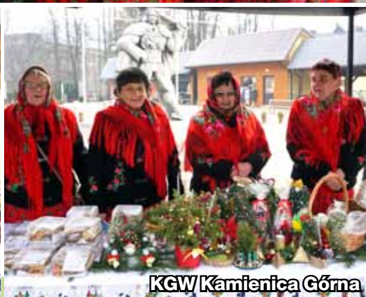
KGW Kamienica Górna