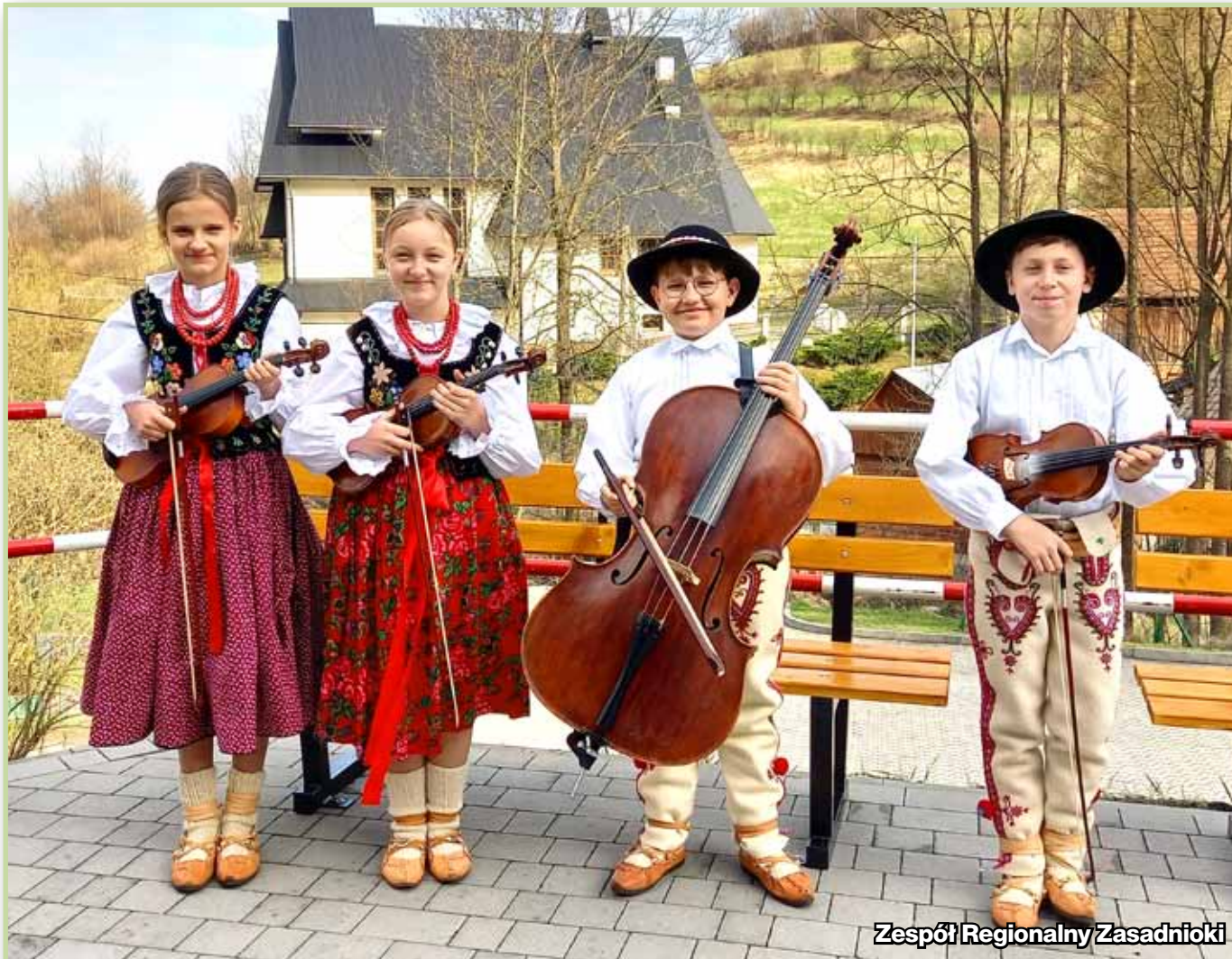
Zespół Regionalny Zasadnioki

W dniach 6 – 8 maja br. w Podegrodziu odbył się 38. Konkurs Muzyk, Instrumentalistów, Śpiewaków Ludowych i Drużbów Weselnych „Druzbacka”.