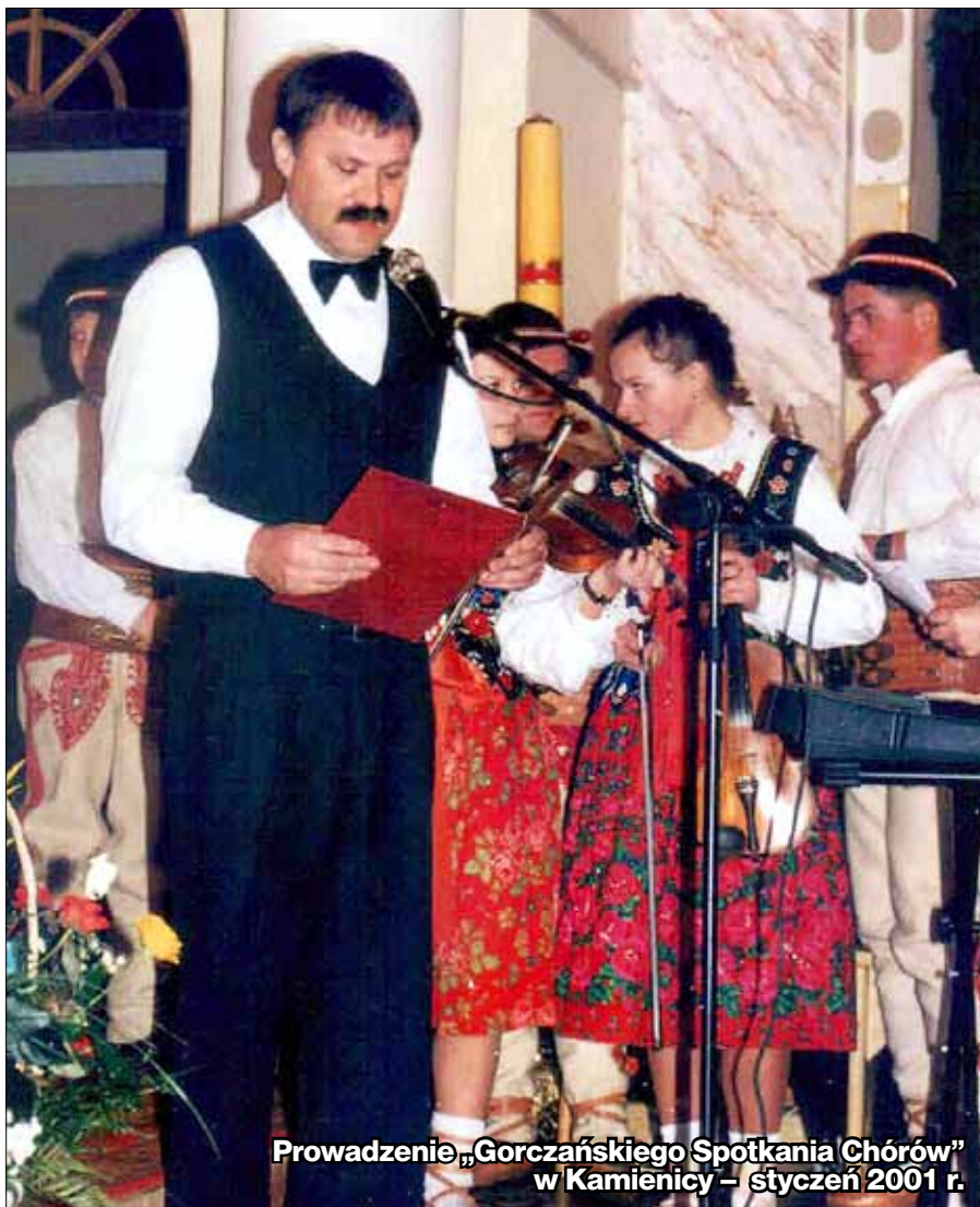
Prowadzenie „Gorczańskiego Spotkania Chórów” w Kamienicy – styczeń 2001 r.

▶ się stowarzyszeniami i otrzymując wielorakie wsparcie, ale też szersze możliwości działania; dobrze, że dostrzeżono to w samorządzie i w rządzie. Z GOK-iem Koła nadal pozostają w przyjaźni, z czego się bardzo cieszę. Ochotnicze Straże Pożarne to kolejny podmiot wspierający nasze zadania – największym naszym wspólnym działaniem, tj. strażaków i GOK-u było zabezpieczanie Dni Gorczańskich, z którego to zadania poszczególne jednostki OSP wywiązywały się zawsze wzorowo. Bardzo dobrze wspominam współpracę z OSP w Szczawie, gdzie przez kilka lat odbywał się Gminny Przegląd KGW, czy wspólne działania z OSP w Zalesiu podczas Gminnych Dożynek. To dzięki przychylności i współpracy naszych strażaków działalność kulturalna GOK może się rozwijać w Zbludzy