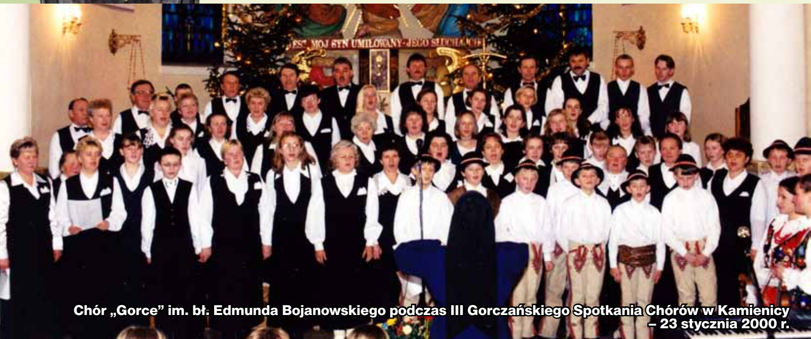
Chór „Gorce” im. bł. Edmunda Bojanowskiego podczas III Gorceńskiego Spotkania Chórów w Kamienicy – 23 stycznia 2000 r.