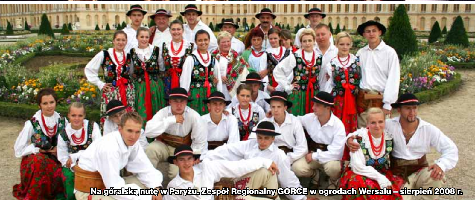
Na góralską nutę w Paryżu. Zespół Regionalny GORCE w ogrodach Wersalu – sierpień 2008 r.