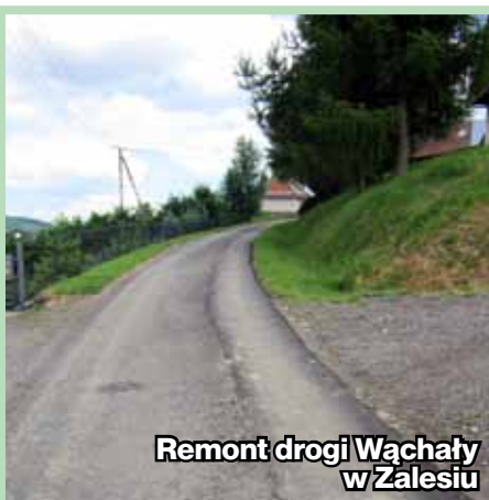
Remont drogi Wąchaty w Zalesiu

W ostatnim czasie zakończono kilka wieloletnich inwestycji realizowanych przez Gminę Kamienica w latach 2018-2021. Najważniejszą z nich była budowa hali sportowej w Kamienicy. Wartość tej inwestycji przekroczyła 8 mln zł, z czego 4 mln pozyskano z Ministerstwa Sportu i Turystyki. Obecnie trwają procedury odbiorowe związane z uzyskaniem pozwolenia na użytkowanie obiektu.