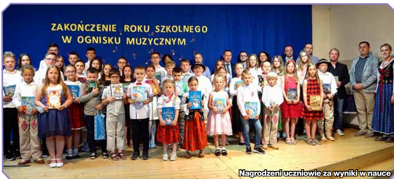
Nagrodzeni uczniowie za wyniki w nauce

28 czerwca odbyło się zakończenie roku szkolnego dla uczniów Ogniska Muzycznego Gminnego Ośrodka Kultury w Kamienicy.