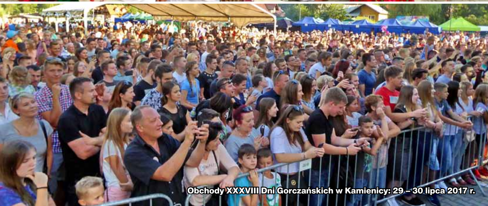
Obchody XXXVIII Dni Gorceńskich w Kamienicy: 29 – 30 lipca 2017 r.