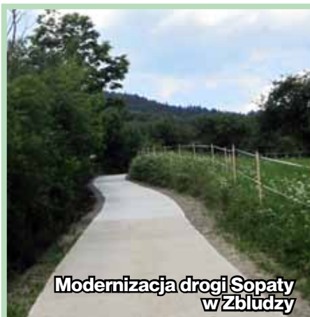
Modernizacja drogi Sopoty w Zbludzy