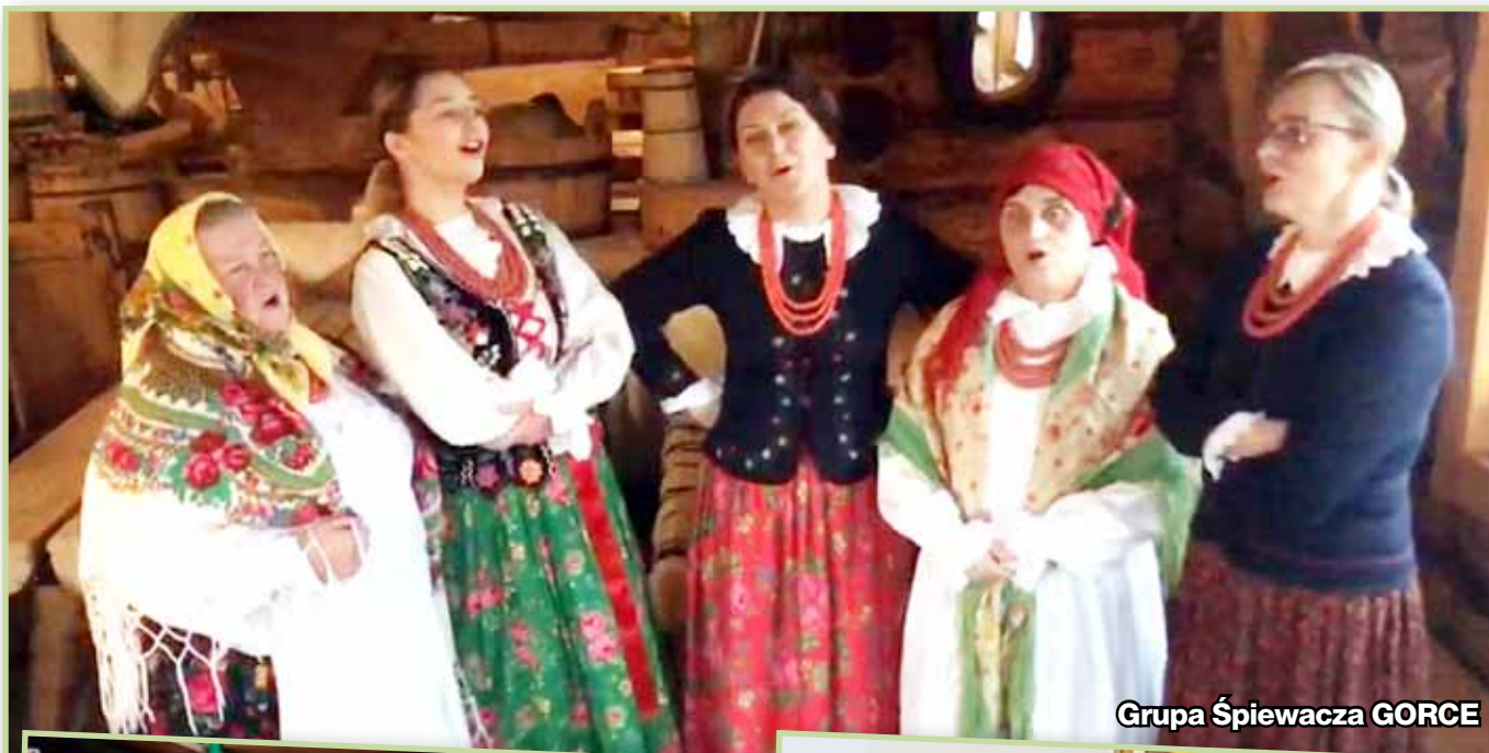
Grupa Śpiewacza GORCE