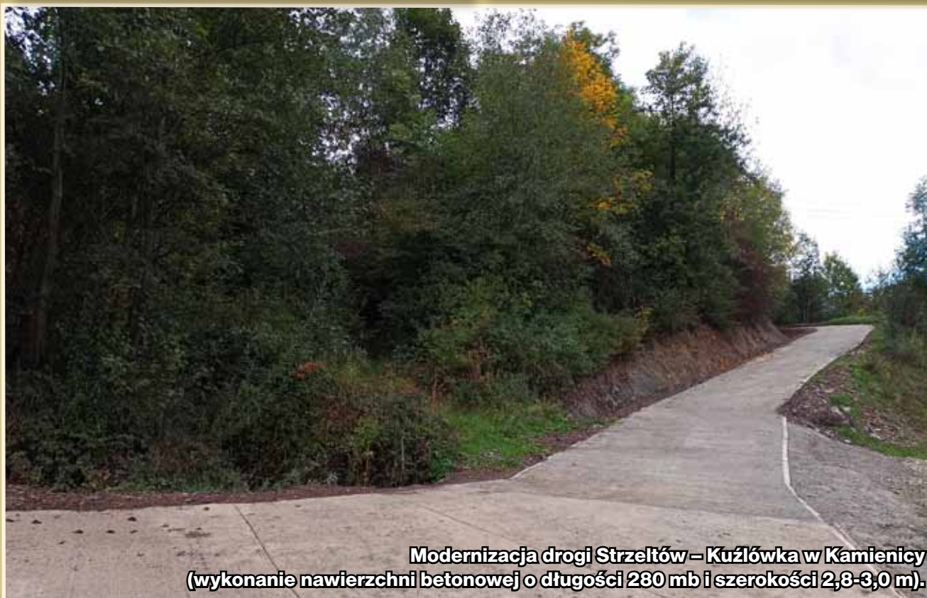
Modernizacja drogi Strzeltów – Kuźłówka w Kamienicy (wykonanie nawierzchni betonowej o długości 280 mb i szerokości 2,8-3,0 m).