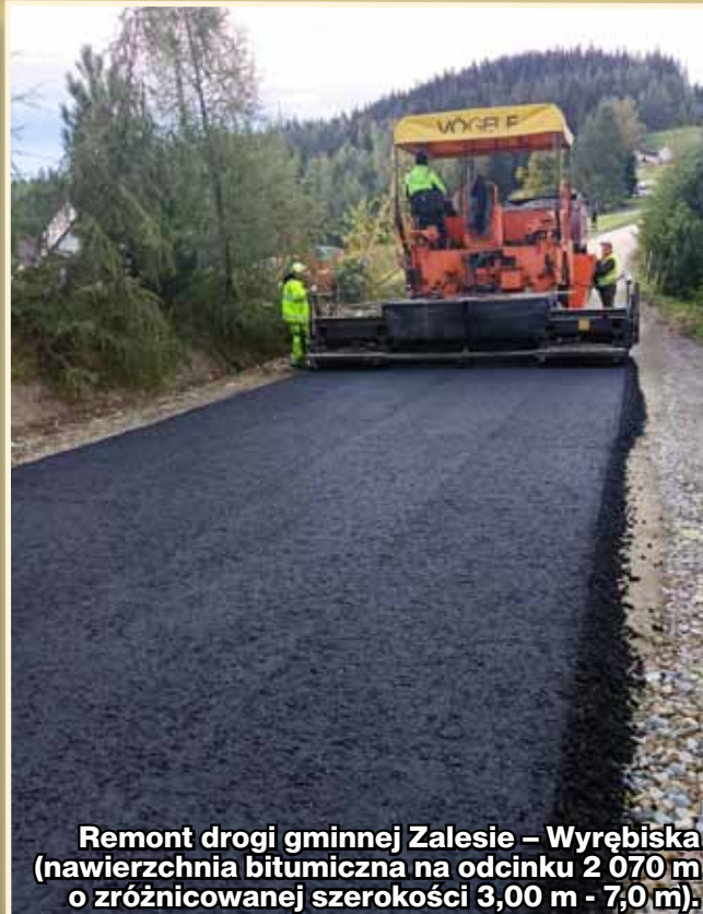
Remont drogi gminnej Zalesie – Wyřebiska (nawierzchnia bitumiczna na odcinku 2 070 m o zróżnicowanej szerokości 3,00 m - 7,0 m).