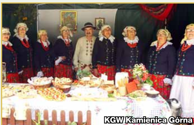
KGW Kamienica Górna