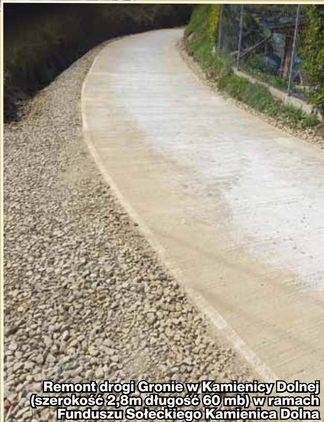
Remont drogi Gronie w Kamienicy Dolnej (szerokość 2,8m długość 60 mb) w ramach Funduszu Sołectkiego Kamienica Dolna