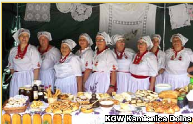
KGW Kamienica Dolna