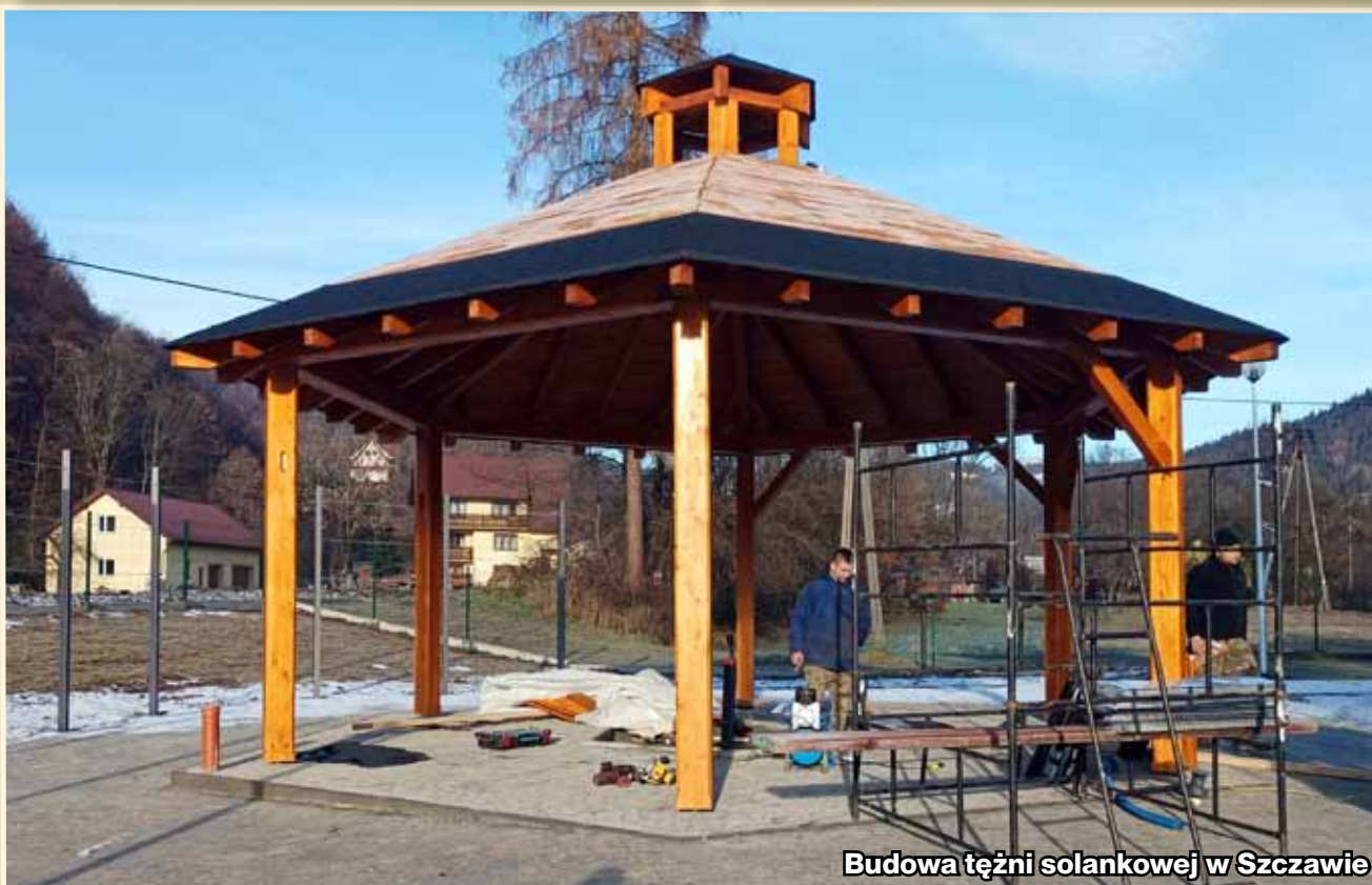
Budowa ężni solankowej w Szczawie