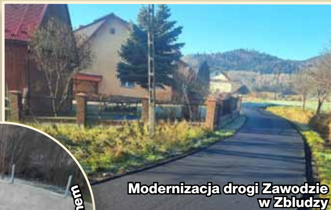
Modernizacja drogi Zawodzie w Zbludzy