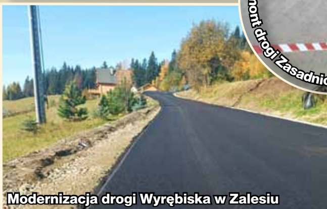
Modernizacja drogi Wyrębiska w Zalesiu