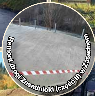
Remont drogi Zasadnioki (część II) w Zasadnem