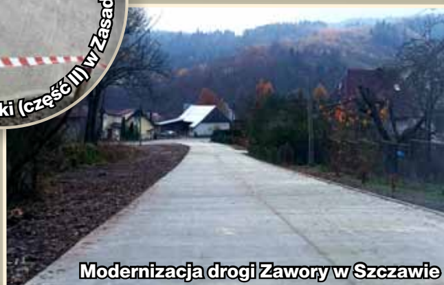
Modernizacja drogi Zawory w Szczawie