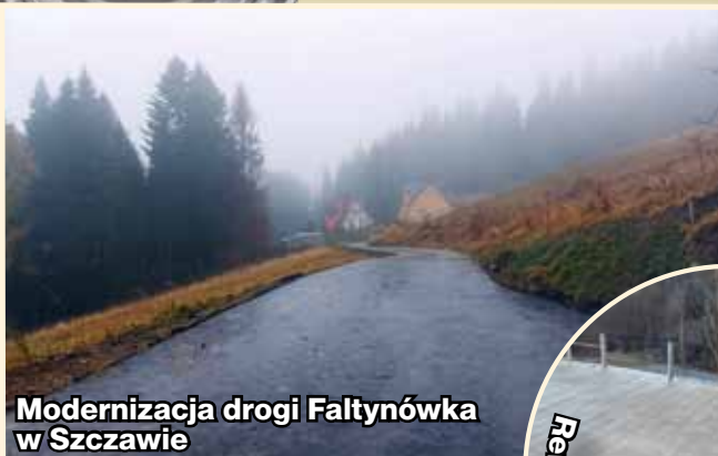
Modernizacja drogi Faltynówka w Szczawie