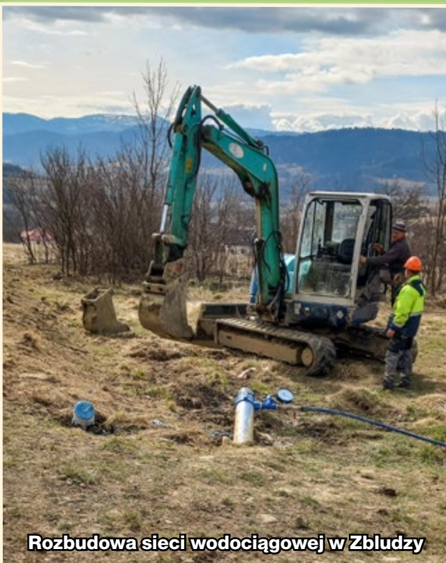
Rozbudowa sieci wodociągowej w Zbludzy