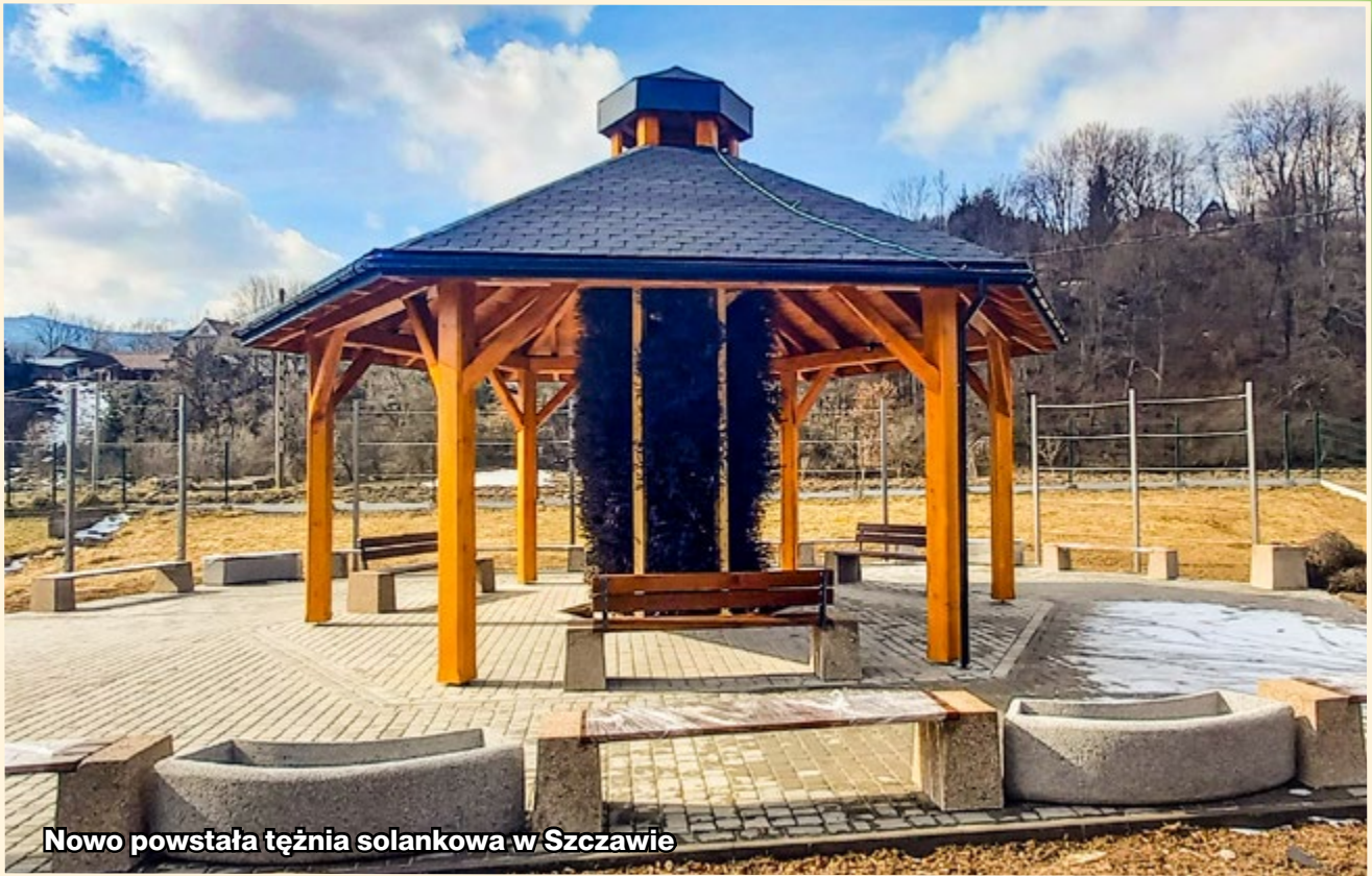
Nowo powstała tężnia solankowa w Szczawie