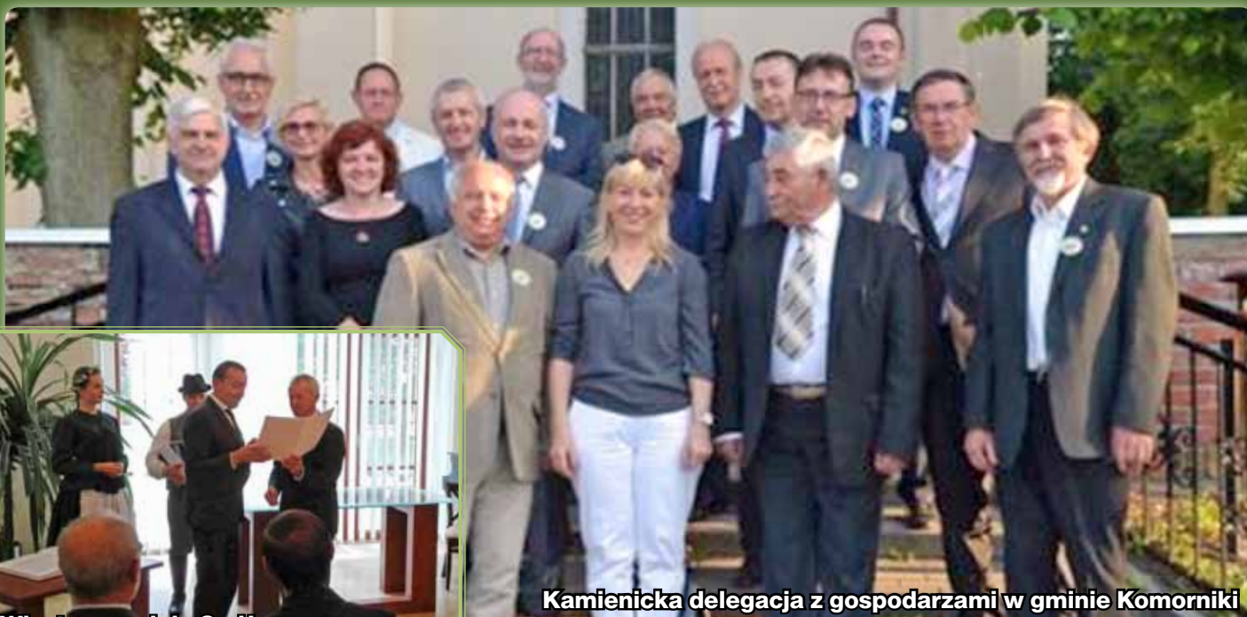
Kamienicka delegacja z gospodarzami w gminie Komorniki

Na przełomie maja i czerwca delegacja gminy Kamienica przebywała w partnerskich gminach Komorniki i Smiżany. Wzięła udział w wydarzeniach ważnych dla społeczności zaprzyjaźnionych gmin.