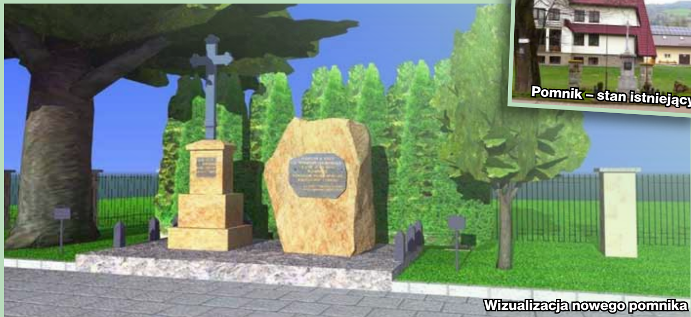
Wizualizacja nowego pomnika

W związku z obchodami w 2018 roku 100-letniej rocznicy odzyskania przez Polskę niepodległości podjęto inicjatywę budowy pomnika (obelisku) upamiętniającego to wydarzenie.