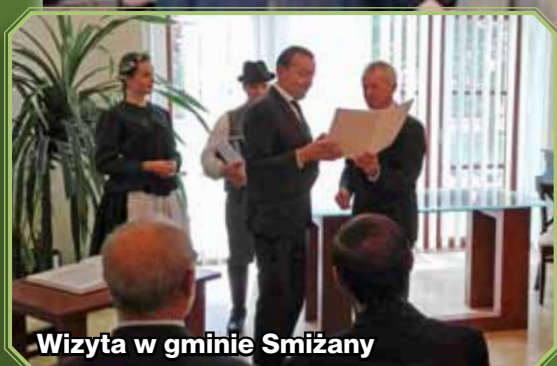
Wizyta w gminie Smiżany