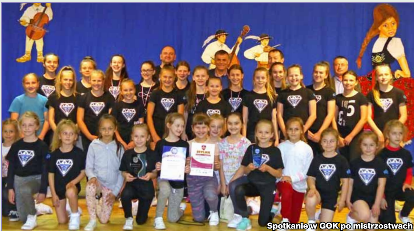
Spotkanie w GOK po mistrzostwach