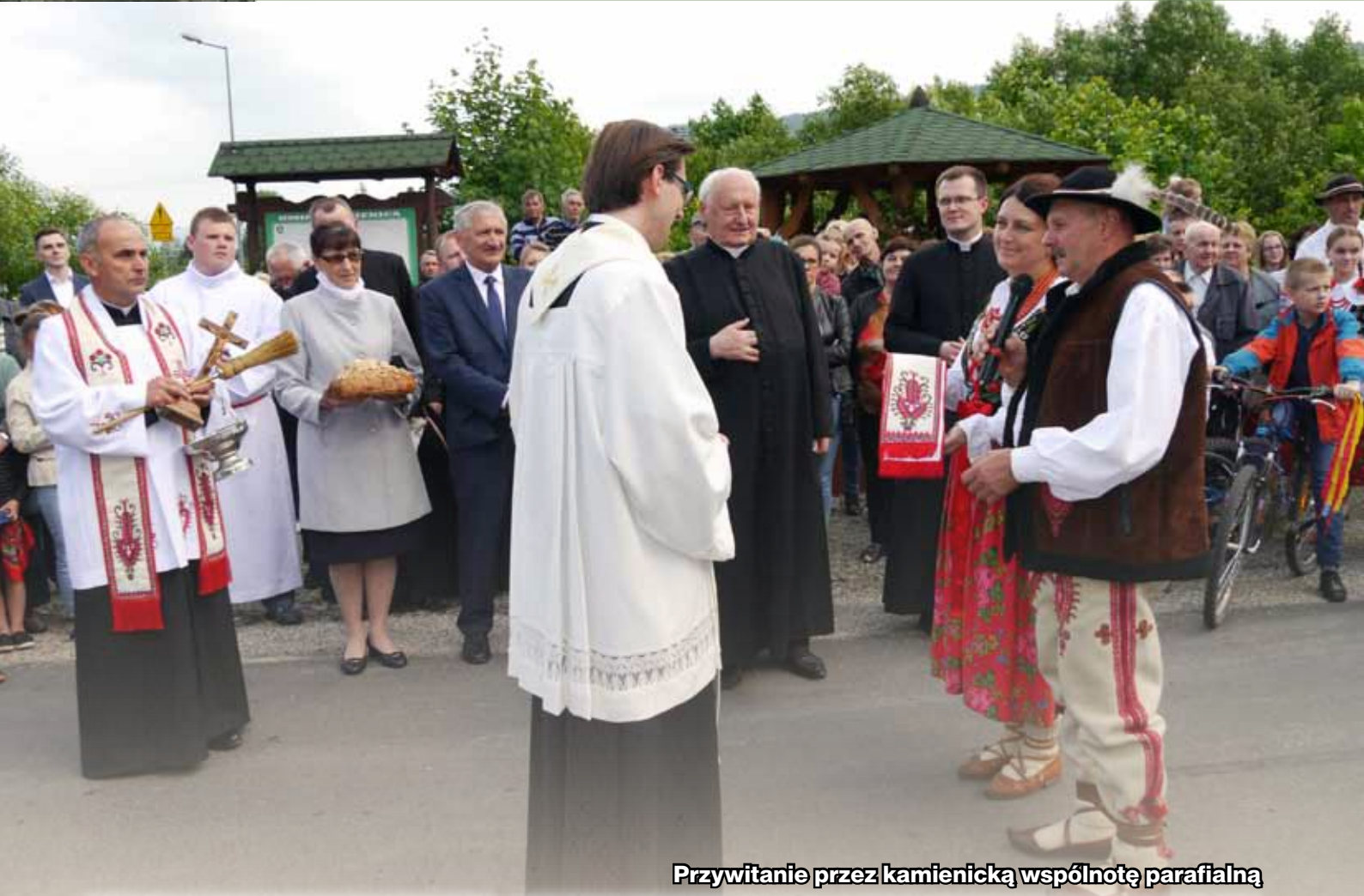
Przywitanie przez kamienicką wspólnotę parafialną