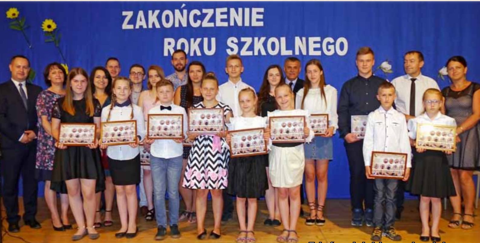
Zakończenie kolejnego roku szkolnego