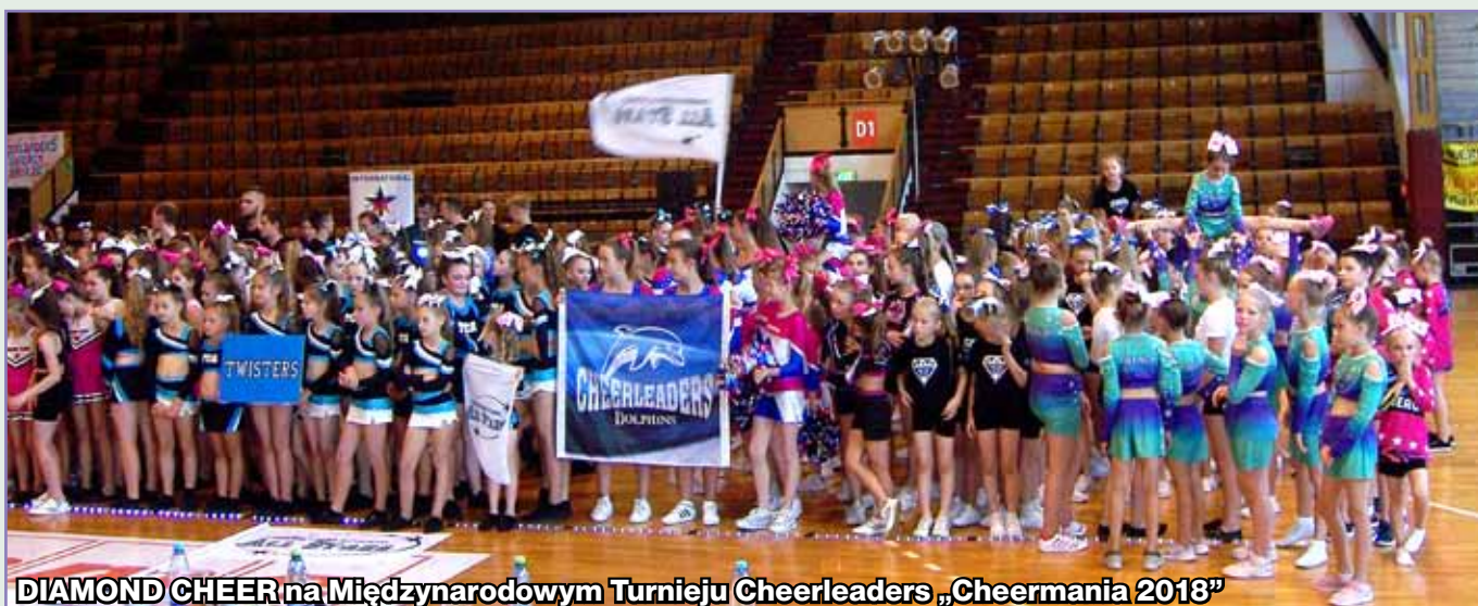
DIAMOND CHEER na Międzynarodowym Turnieju Cheerleaders „Cheermania 2018”