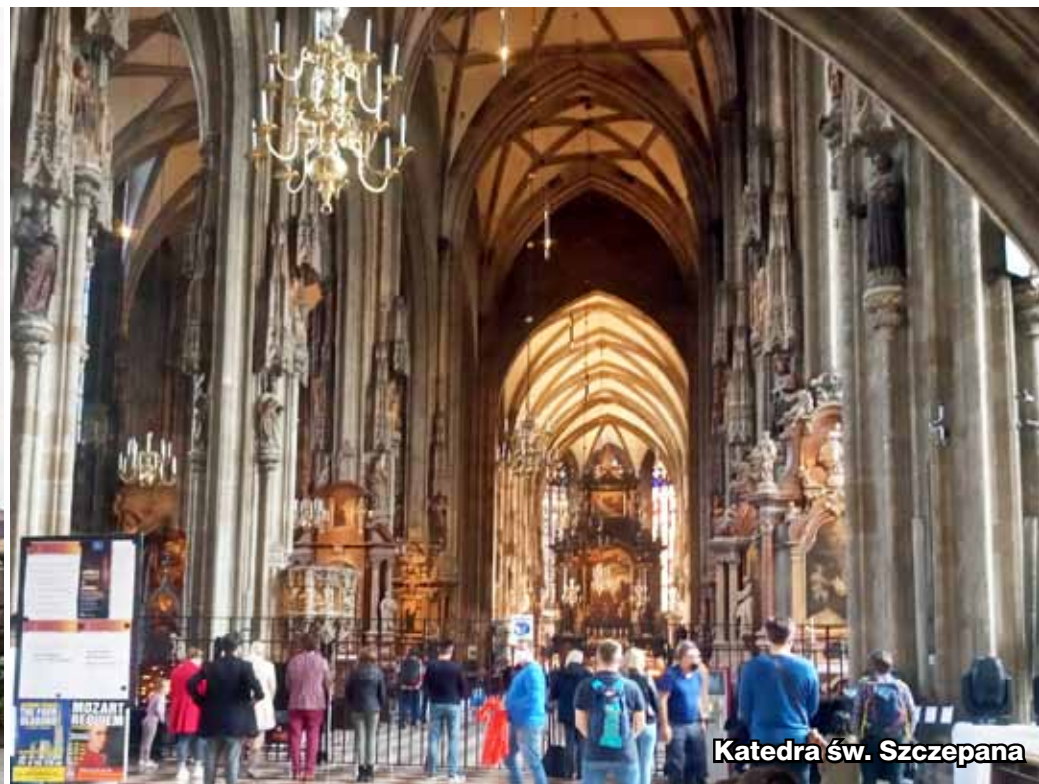
Katedra św. Szczepana