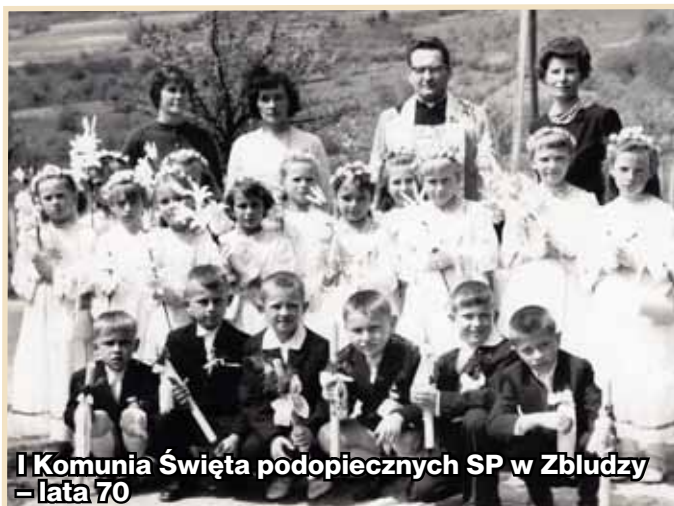
I Komunia Święta podopiecznych SP w Zbludzy – lata 70