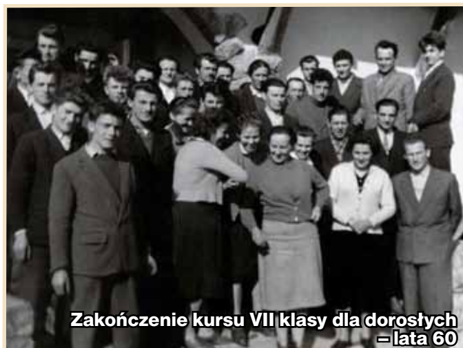
Zakończenie kursu VII klasy dla dorosłych – lata 60