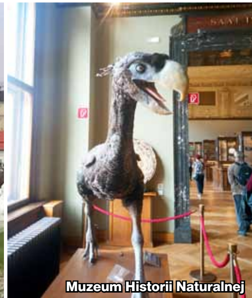
Muzeum Historii Naturalnej