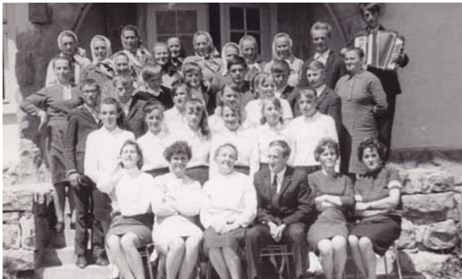
Zakończenie roku szkolnego (klasa VIII) – 13.06.1970 r.