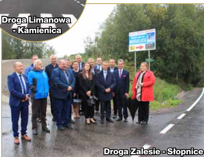
Droga Zalesie - Słopnice