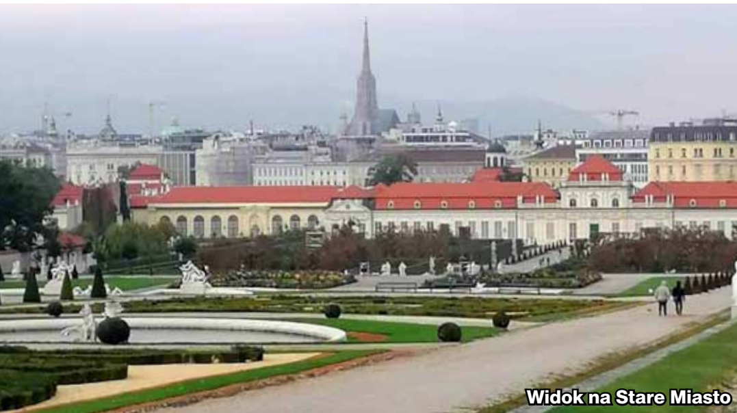
Widok na Stare Miasto