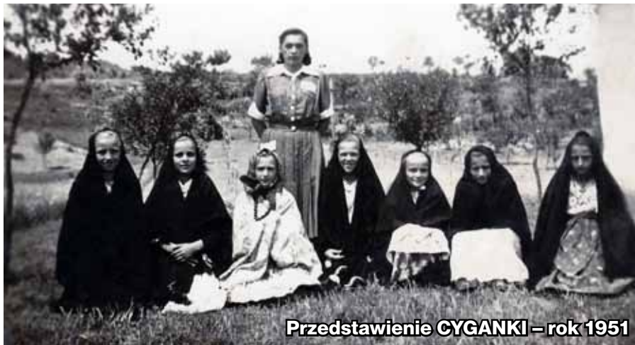
Przedstawienie CYGANKI – rok 1951

Ja na początku uczyłam w szkole języka polskiego, historii