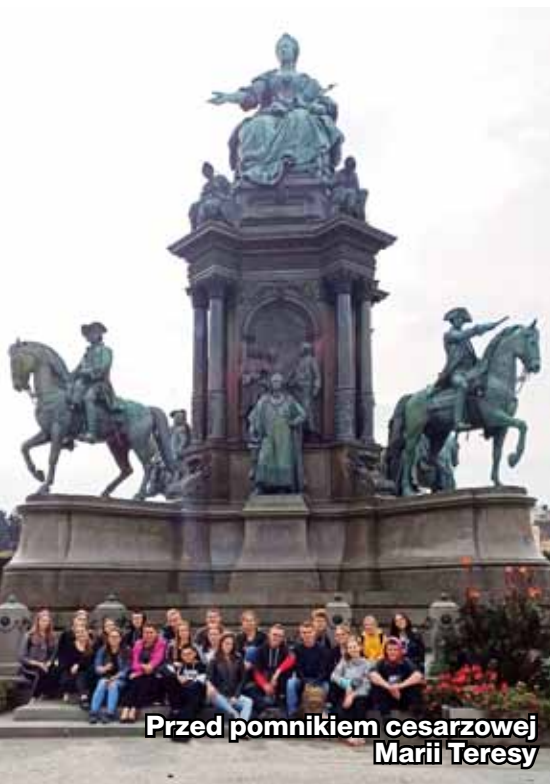
Przed pomnikiem cesarzowej Marii Teresy