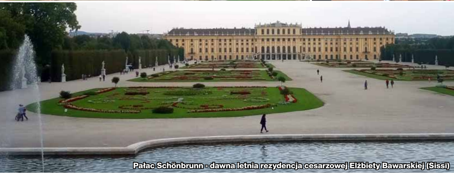
Pałac Schönbrunn - dawna letnia rezydencja cesarzowej Elżbiety Bawarskiej (Sissi)