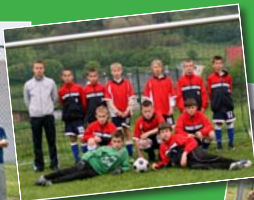
Drużyny z Kamienicy