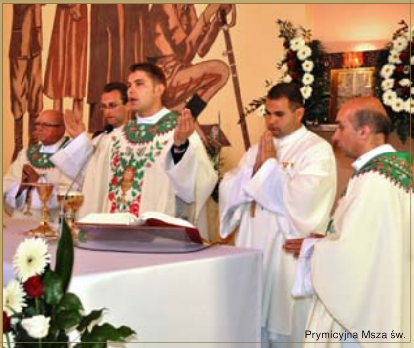
Prymicyjna Msza św.