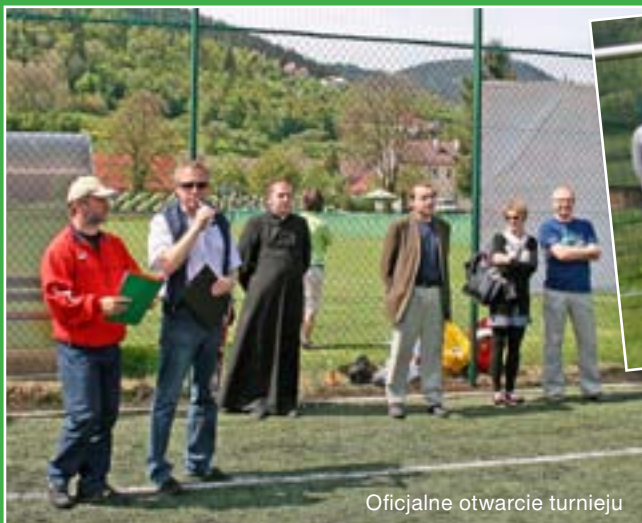
Oficjalne otwarcie turnieju