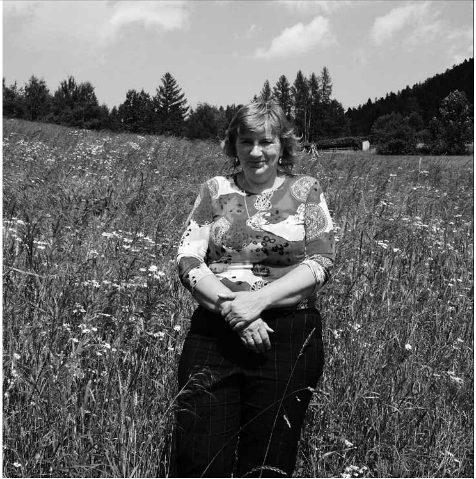
Ziemia żywi i daje się pokochać temu, który ją uprawia