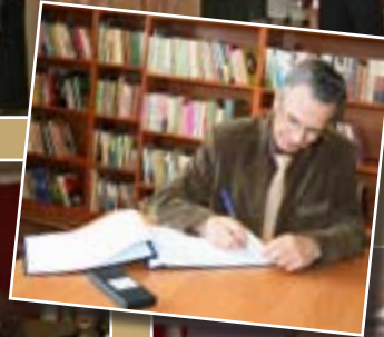
Wpis do księgi pamiątkowej