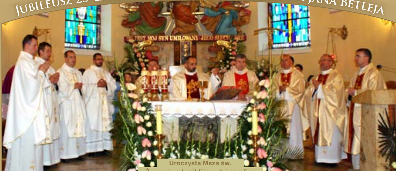
Uroczysta Msza św. Życzenia od najbliższych i parafian