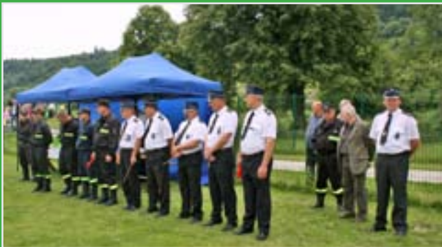
Zbiórka jednostek przed rozpoczęciem rywalizacji