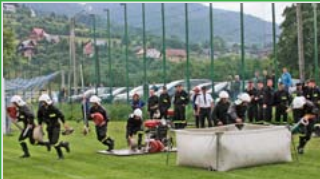
Sztafeta pożarnicza z przeszkodami i ćwiczenia bojowe