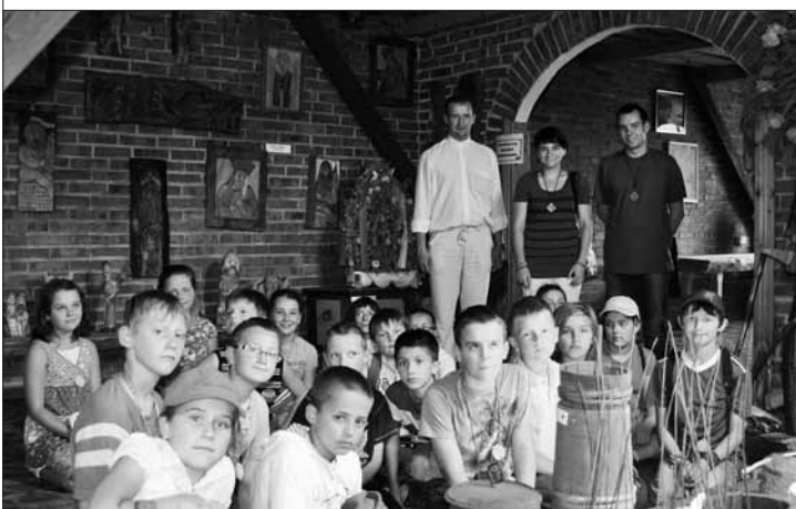
Bocheńscy oazowicze w spotkaniu z naszą kulturą