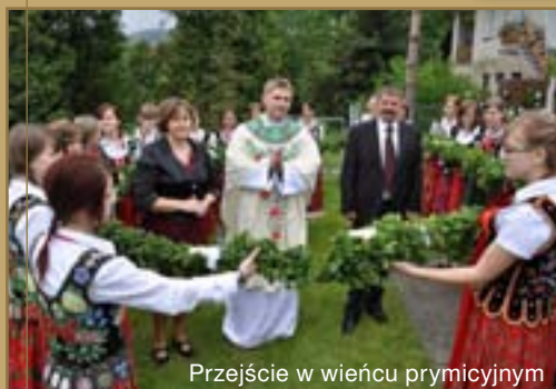
Przejście w wieńcu prymicyjnym