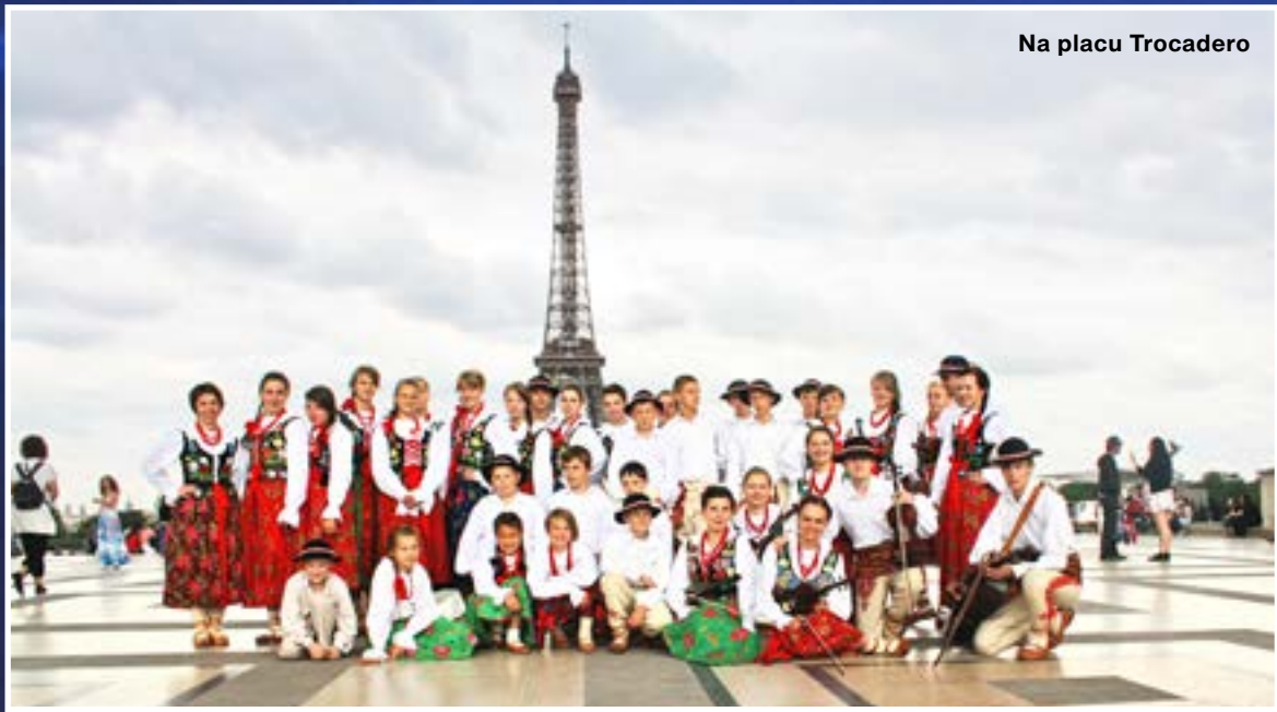
Na placu Trocadero