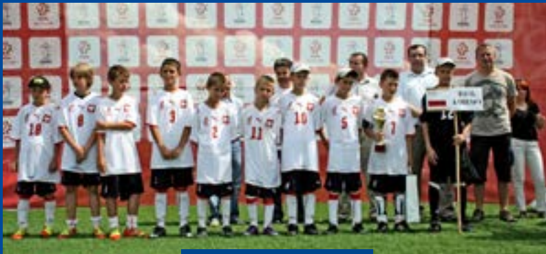
Drużyny z Kamienicy