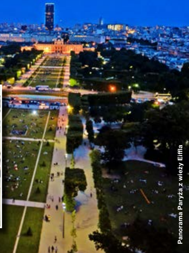
Panorama Paryża z wieży Eiffla