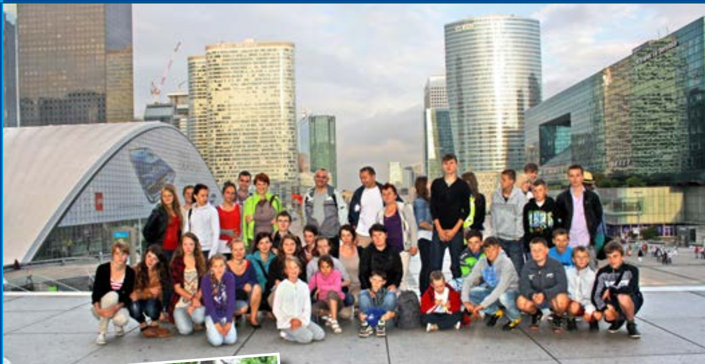
Na La Défense