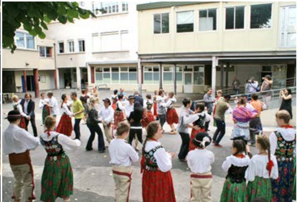
Koncert i wspólne tańce w Bagnolet