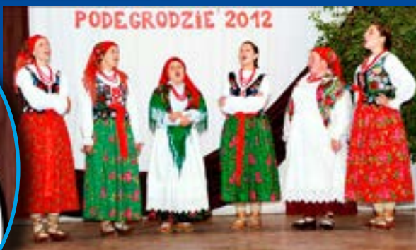
Grupa Śpiewacza GORCE