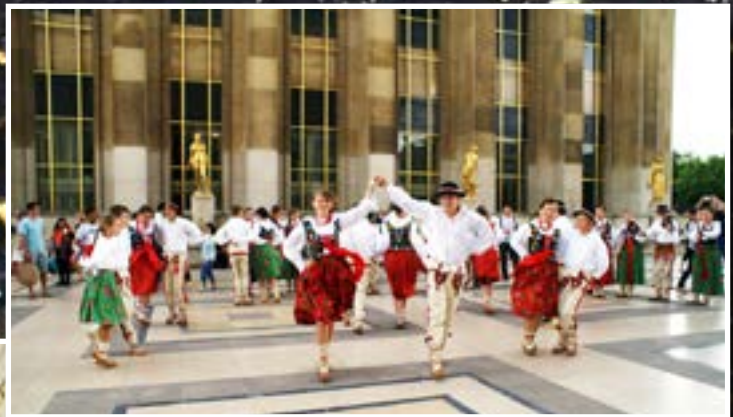
Na placu Trocadero