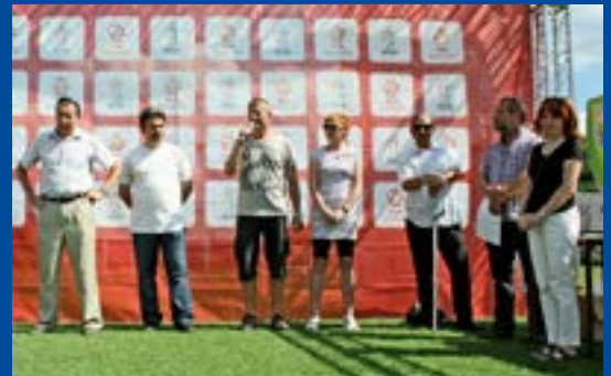
Oficjalne zakończenie turnieju