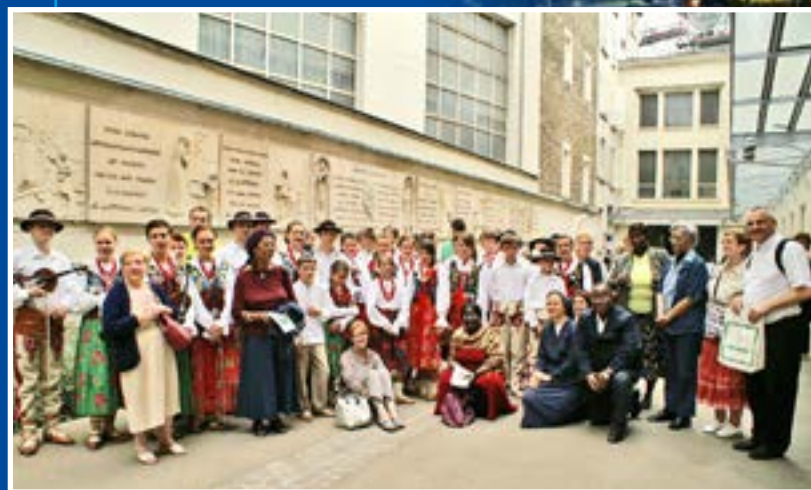
W Kaplicy Cudownego Medalika na rue du Bac