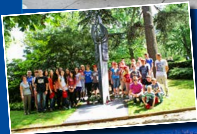
Na cmentarzu Père Lachaise