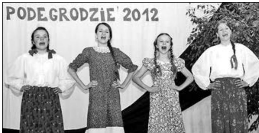
Grupa śpiewacza "Pastyreczki"