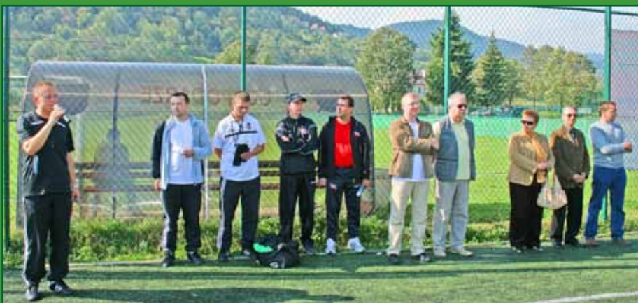
Oficjalne otwarcie turnieju