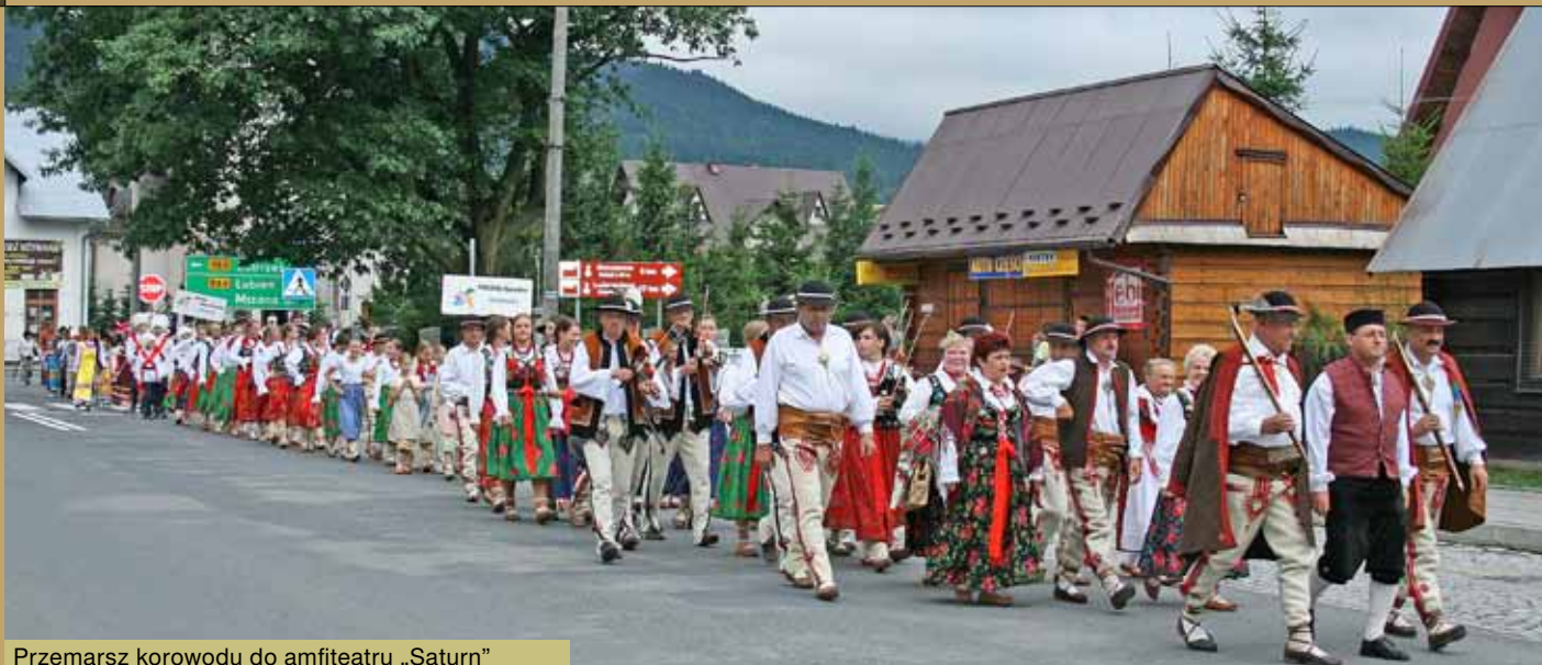
Przemarsz korowodu do amfiteatru „Saturn”