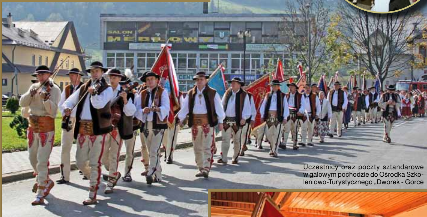
Uczestnicy oraz poczty sztandarowe w galowym pochodzie do Ośrodka Szkoleniowo-Turystycznego „Dworek - Gorce