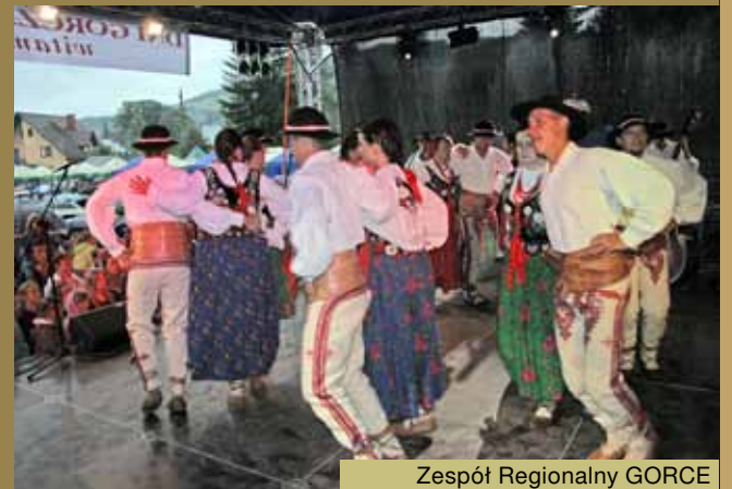
Zespół Regionalny GORCE