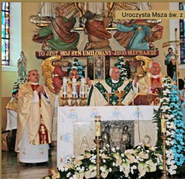
Uroczysta Msza św. z poświęceniem sztandaru