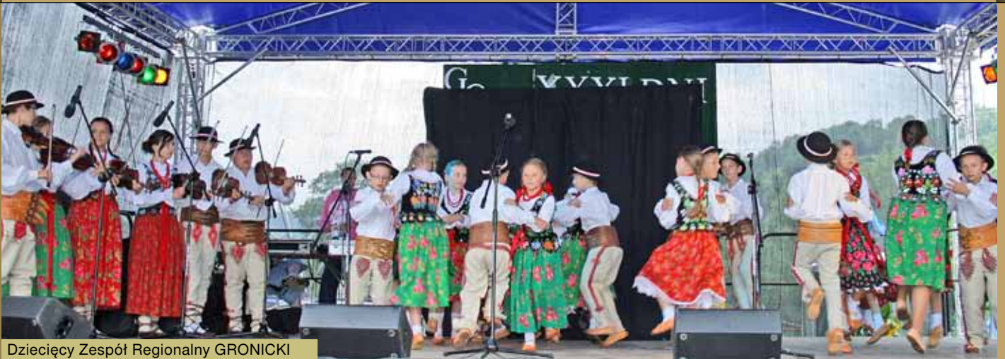
Dzieci Zespół Regionalny GRONICKI