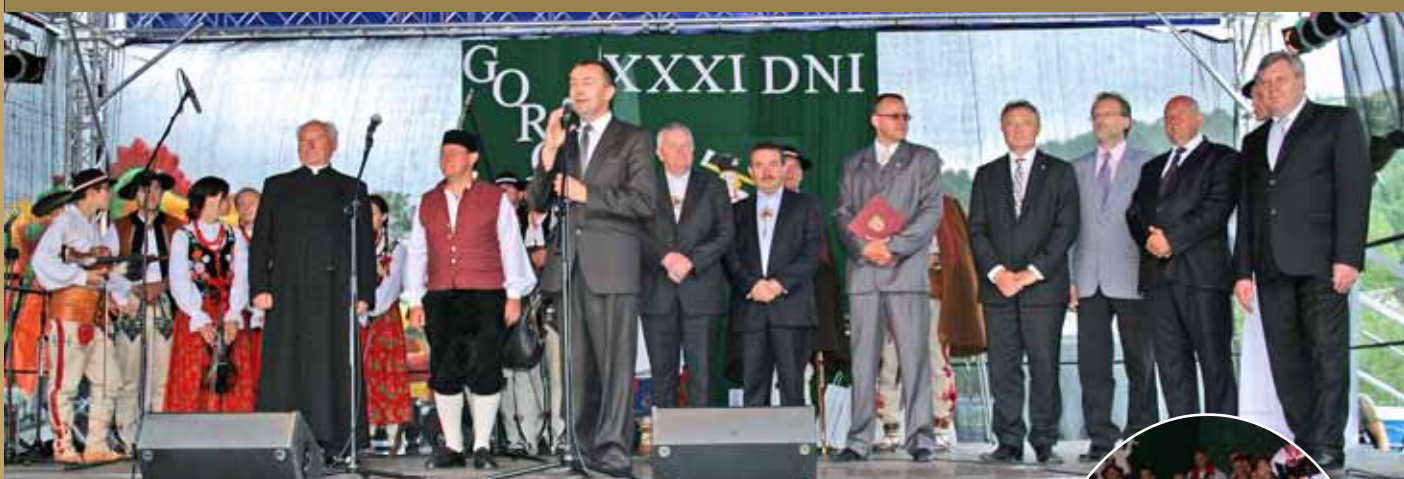
Oficjalne otwarcie i powitanie zaproszonych gości