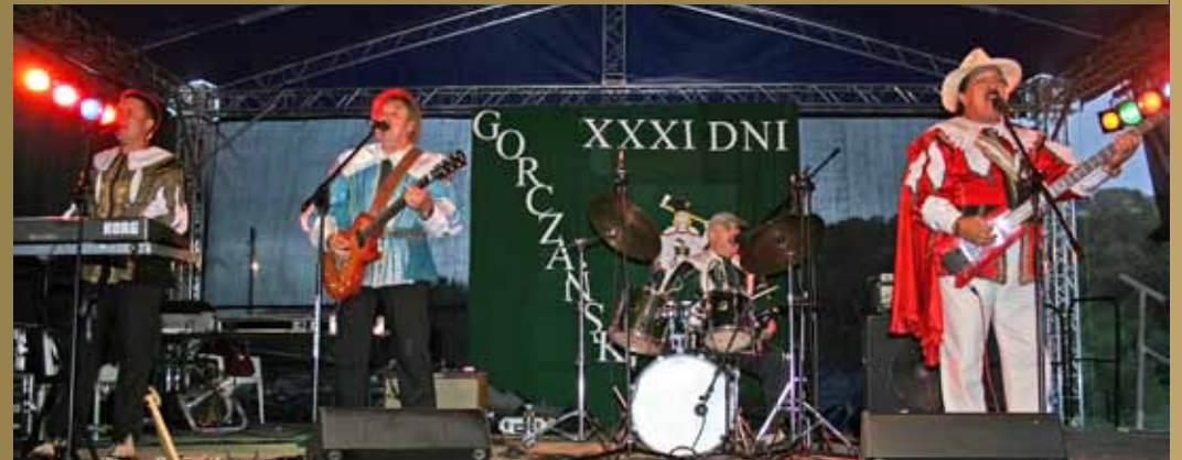
Występ zespołu TRUBADURZY