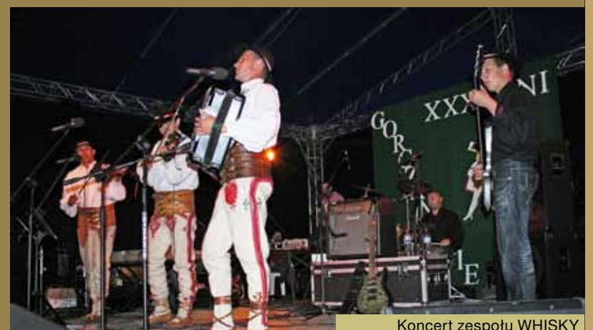
Koncert zespołu WHISKY