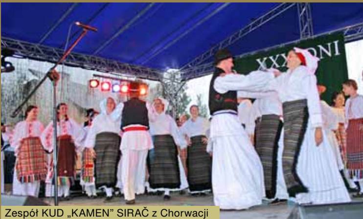
Zespół KUD „KAMEN” SIRAČ z Chorwacji