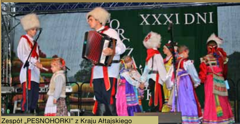
Zespół „PESNOHORKI” z Kraju Ałtajskiego