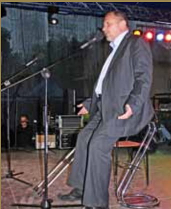
Kabaretowy show Andrzeja Grabowskiego