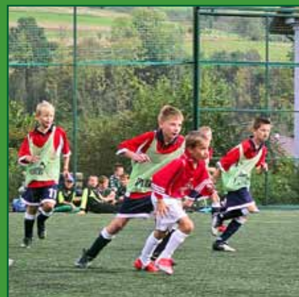
Halny Kamienica w meczu z Zakopaniem